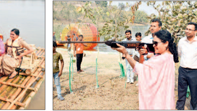
ये रहे उपस्थित

कॉम्प्लेक्स निर्माण करने की भी मांग की। राष्ट्रीय बाल संरक्षण आयोग के पूर्व सदस्य यशवंत जैन ने सियादेवी जलाशय को इको टूरिज्म पर्यटन क्षेत्र के रूप में विकसित करने हेतु बालोद जिला प्रशासन द्वारा आयोजित इस 3 दिवसीय सियादेवी इको एडवेंचर फेस्ट बेहतरीन आयोजन को मुक्त कंठ से सराहना की। उन्होंने कहा कि कलेक्टर मिश्रा के मागदर्शन में जिला प्रशासन द्वारा प्रकृति के इस खूबसूरत वादियों के