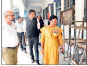
कलेक्टर ने एकलव्य महाविद्यालय का किया निरीक्षण