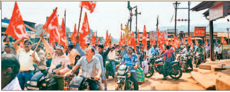
बाइक रैली और आमसभा से गुंजा शहर: सुबह 11 बजे पूरे शहर में बाइक रैली निकाली गई, जिसमें नए श्रम कानून रद्द करने के नारे से दल्लीराजहरा गुंजा उठा। शाम 4 बजे माईस ऑफिस के सामने विशाल आमसभा का आयोजन हुआ, जिसमें बड़ी संख्या में श्रमिकों की भागीदारी रही।

मजदूर विरोधी हैं। इन कानूनों से काम के घंटे 12 घंटे तक बढ़ाए जा रहे हैं, 300 तक मजदूर वाले संस्थानों में छंटनी और तालाबंदी की खुली छूट दी जा रही है, हड़ताल जैसे लोकतांत्रिक अधिकारों पर पाबंदी लगाई जा रही है और श्रमिक संगठनों को कमजोर करने का षड्यंत्र रचा गया है। ये कानून मजदूरों को अधिकार नहीं, गुलामी की ओर धकेलते हैं। वहीं संगठन