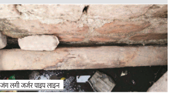
जंग लगी जर्जर पाइप लाइन