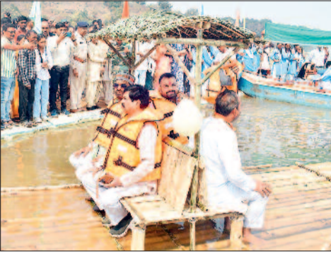
हरिभूमि न्यूज | बालोद

नारागांव में प्रकृति की मनोरम वादियों के बीच स्थित सियादेवी जलाशय के तट पर शुक्रवार को 3 दिवसीय सियादेवी इको टूरिज्म फेस्ट का शुभारंभ किया गया। इस दौरान स्थानीय विधायक, जिला पंचायत अध्यक्ष एवं उपाध्यक्ष सहित अन्य जनप्रतिनिधि के अलावा कलेक्टर, वनमण्डलाधिकारी, जिला पंचायत के मुख्य कार्यपालन अधिकारी व अन्य जनप्रतिनिधियों एवं अधिकारी-कर्मचारियों ने बैम्बू राफ्टिंग में सवार होकर सियादेवी जलाशय के भ्रमण का लुत्फ उठाया।