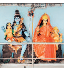
बालोद/कलंगपुर